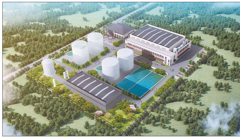
餐厨废弃物处理工程效果图 (资料图片)