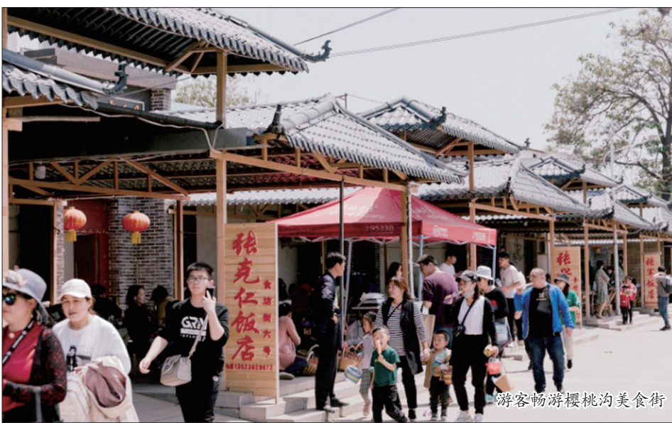
游客畅游樱桃沟美食街

2017年10月,党的十九大作出了实施乡村振兴战略的重大决策部署,广袤农村迎来历史性的重大机遇。西工区委、区政府认真贯彻落实中央、省委、市委决策部署,把实施乡村振兴战略摆在优先位置,编制《西工区乡村振兴战略规划(2018—2022年)》。为使规划落地生根,形成生动实践,红山街道办以党建为引领,把实施乡村振兴战略作为新时代做好“三农”工作的总抓手推进工作;以创建田园综合体、打造特色生态旅游基地为目标,以产业融合发展为手段,以重点项目为支撑,为乡村全面振兴添加磅礴动能,一幅产业兴旺、生态宜居、乡风文明、治理有效、生活富裕的斑斓画卷正徐徐展开。