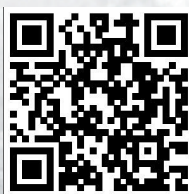
扫二维码观看相关视频