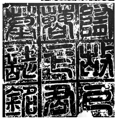
隋《下鉴墓志》盖拓本