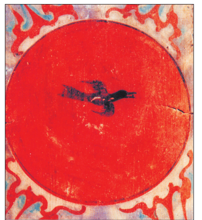
▲西汉卜千秋墓壁画中的太阳

古人仰观天象，以日月星辰的运行周期和所在位置来划分四季，并以此为依据安排日常生活。现存于河南古代壁画馆的诸多壁画中，都出现了日与月的形象。由此可见，古人对天象崇拜之深。 在汉墓壁画中，日与月是必不可少要素，而且一定是同时出现，缺一不可，其寓意为万物化生，生生不息。出土于西汉卜千秋墓和浅井头西汉墓中的日与月壁画可谓日月形象代表，形象地表达了汉代人渴望生生不息的美好愿望。从外观上看，在绝大多数壁画中的日月都是一个圆轮，但圆轮里的图案不一。