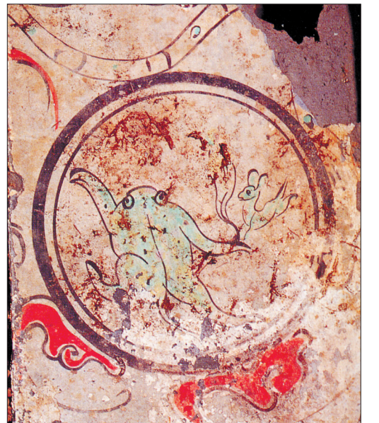
▲浅井头西汉墓壁画中的月亮