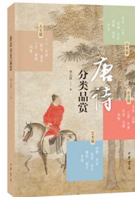
《唐诗分类品赏》 作者:李元洛 出版社:中华书局

皇皇《全唐诗》近五万首,蔚为大观。中国人最熟悉的选本莫过于清朝蘅塘退士编选的风行二百余年的《唐诗三百首》。《唐诗三百首》口碑极好,是唐诗启蒙当之无愧的首选。可是,且不论任何一种选本本身都会有局限性,就其后果——大多数中国人只知道《唐诗三百首》,不知《全唐诗》为何物而言,也有挂一漏万、罔顾其他唐诗之美的遗憾。基于此,古典诗词鉴赏名家李元洛先生以现代人的立场、观念与眼光,选取与《唐诗三百首》无一重复的337首唐诗,分成自然、社会、人生、艺术四类,下设“时空”“环保”“农事”“工商”等28小类,加以悉心品赏,遂成《唐诗分类品赏》一书。此书打撈了不少“遗珠”,堪称适合现代人的上佳唐诗选本。这些“遗珠”,主体是名家之名作,其次是非名家之佳作,还包括“相当数量的未进入古今任何选本、于读者颇具陌生感之佳篇”。