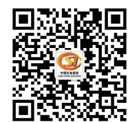
洛阳社保微信公众号