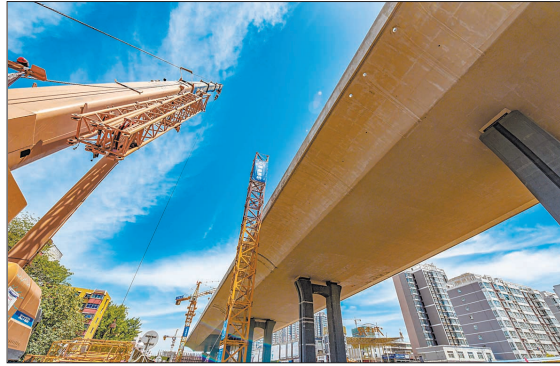
王城大道快速路洛北段高架桥拔地而起