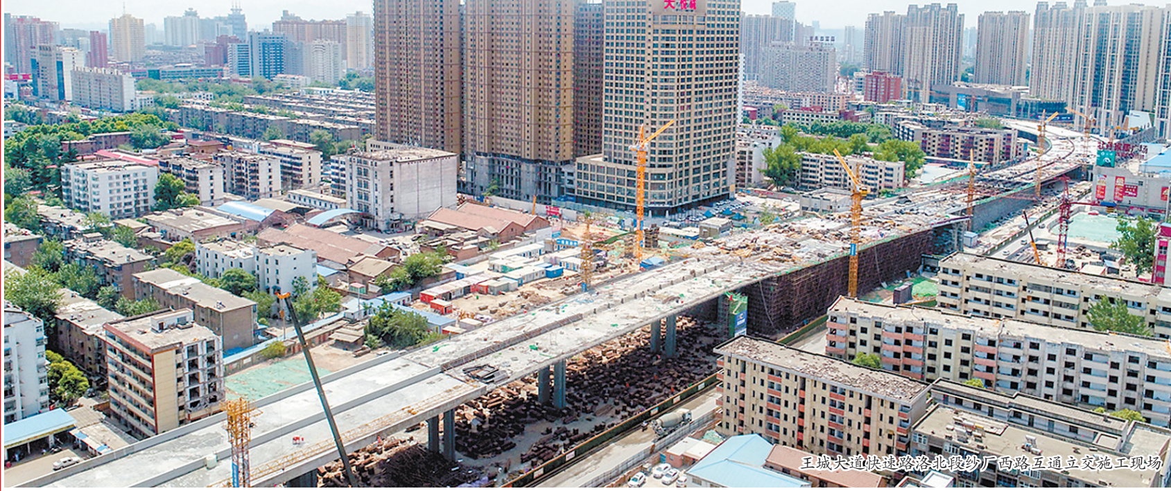
王城大道快速路洛北段纱厂西路互通立交施工现场