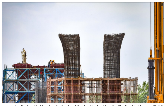
王城大道快速路与机场路交会处互通立交施工现场