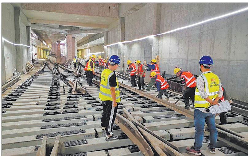
施工人员在地铁1号线启明南路站铺设轨道