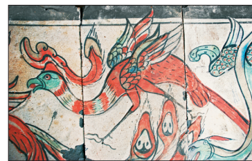
▲新安县磁洞西汉墓壁画中的凤鸟

与凤鸟有关的成语很多，如龙凤呈祥、鸾凤和鸣、有凤来仪等，大都寓意美好、吉祥。这和凤鸟自古被视为吉祥、长生、美丽、高洁的化身有关。在神仙风气盛行的汉代，这种祥瑞之鸟自然引人重视。也正因此，我们可以在汉代壁画中看到，凤鸟经常出现在不同的场景中。