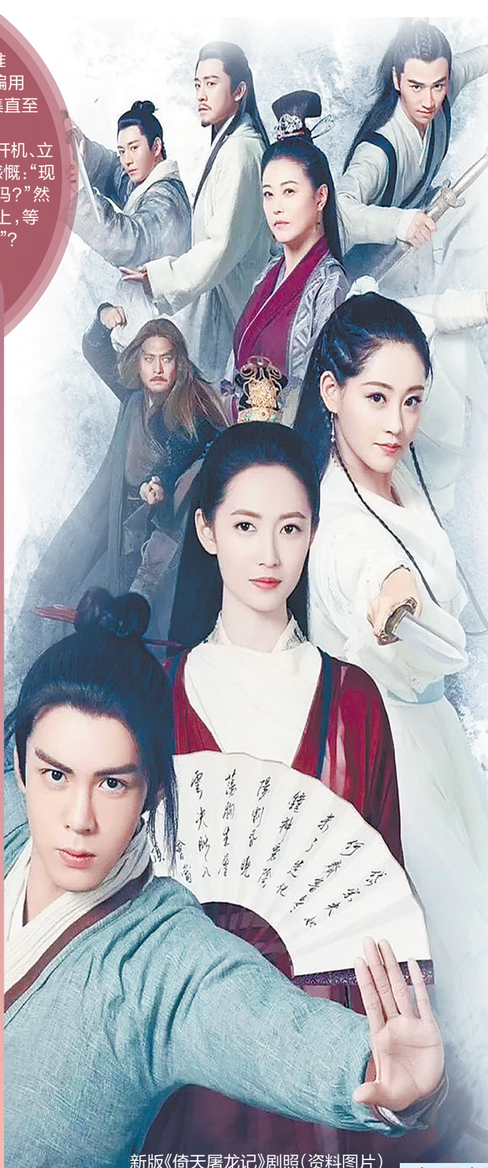
新版《倚天屠龙记》剧照

但令人担忧的是,基于经典影视作品的翻拍已经形成了一套缜密的商业逻辑。翻拍剧在诞生之初就已经站上了“巨人的肩膀”,这能够很大程度上为剧集的市场表现保驾护航,从而降低各方的资金风险,赢得可观的市场收入。此外,翻拍剧还逐渐成为“捧新人”的有效方式之一,正因为如此,翻拍成了各方逐利的着力点。