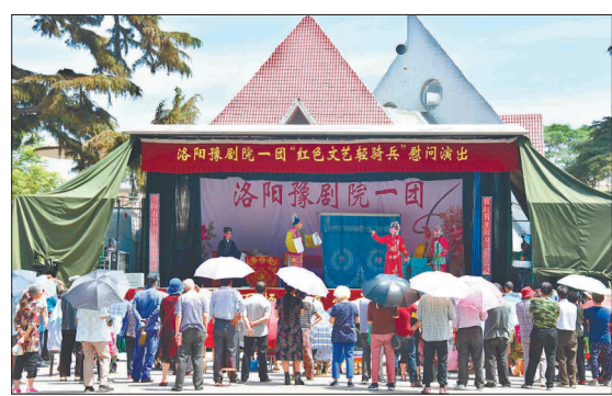
昨日,在牡丹公园南门广场,洛阳豫剧院一团红色文艺轻骑兵工作者冒着酷暑开展公益演出。作为我市重点民生实事之一,5月至10月底,庆祝中华人民共和国成立70周年新时代红色文艺轻骑兵“河洛欢歌·文化惠民演出”活动在隋唐城遗址植物园南门内广场、兴洛湖公园北入口广场、雷峰广场、周王城广场、王城公园正门内广场、牡丹公园南门广场6个广场持续开展,计划演出300场,市民在家门口就可享受免费文化大餐。