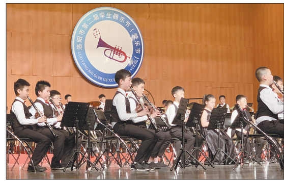
23日上午,北京第二实验小学洛阳分校管乐团在台上表演。当日,洛阳市第二届学生器乐节(管乐节)在市会议中心举行,围绕“新时代 新征程 新使命”主题,全市中小学32支代表队在比赛中展现了热爱祖国、热爱生活、朝气蓬勃、昂扬向上的精神风貌。