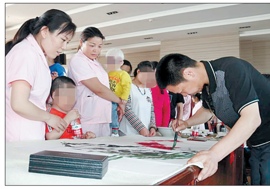
六一儿童节将至。近日,涧西区书法家协会的10多名会员来到洛阳市儿童福利院,现场挥毫泼墨,以墨香润童心,用书画向孩子们送去祝福和礼物。

近期,新版《倚天屠龙记》《新白娘子传奇》《封神演义》相继亮相,随着剧情的不断推进,故事空洞、人物形象扁平、改编用力过猛等问题纷纷凸显,有的剧集直至收官,口碑和播放量都乏善可陈。 今年以来,多个翻拍剧开播、开机、立项,如火如荼之势让许多人不禁感慨:“现在连影视剧都流行走复古风了吗?”然而,在这条行人络绎不绝的道路上,等待着他们的会不会是一场“空欢喜”?