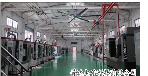
普达电子科技有限公司