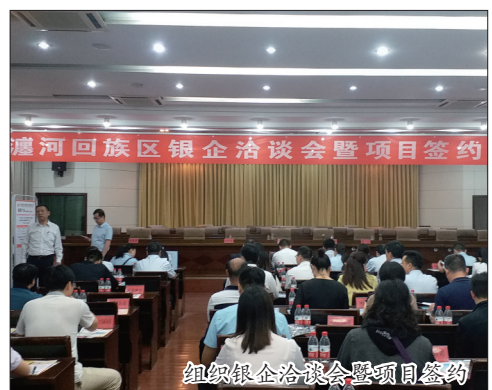
组织银企洽谈会暨项目签约

——发挥“洛阳东大门”的区位优势,以政府为主导,主动联系和对接“三强”企业,引进以汽车相关产业链为主的物流园项目,进一步做大做强该区的现代物流产业,围绕主导产业,推动地企合作再上新台阶,目前已有5个产业化项目基本具备签约条件。