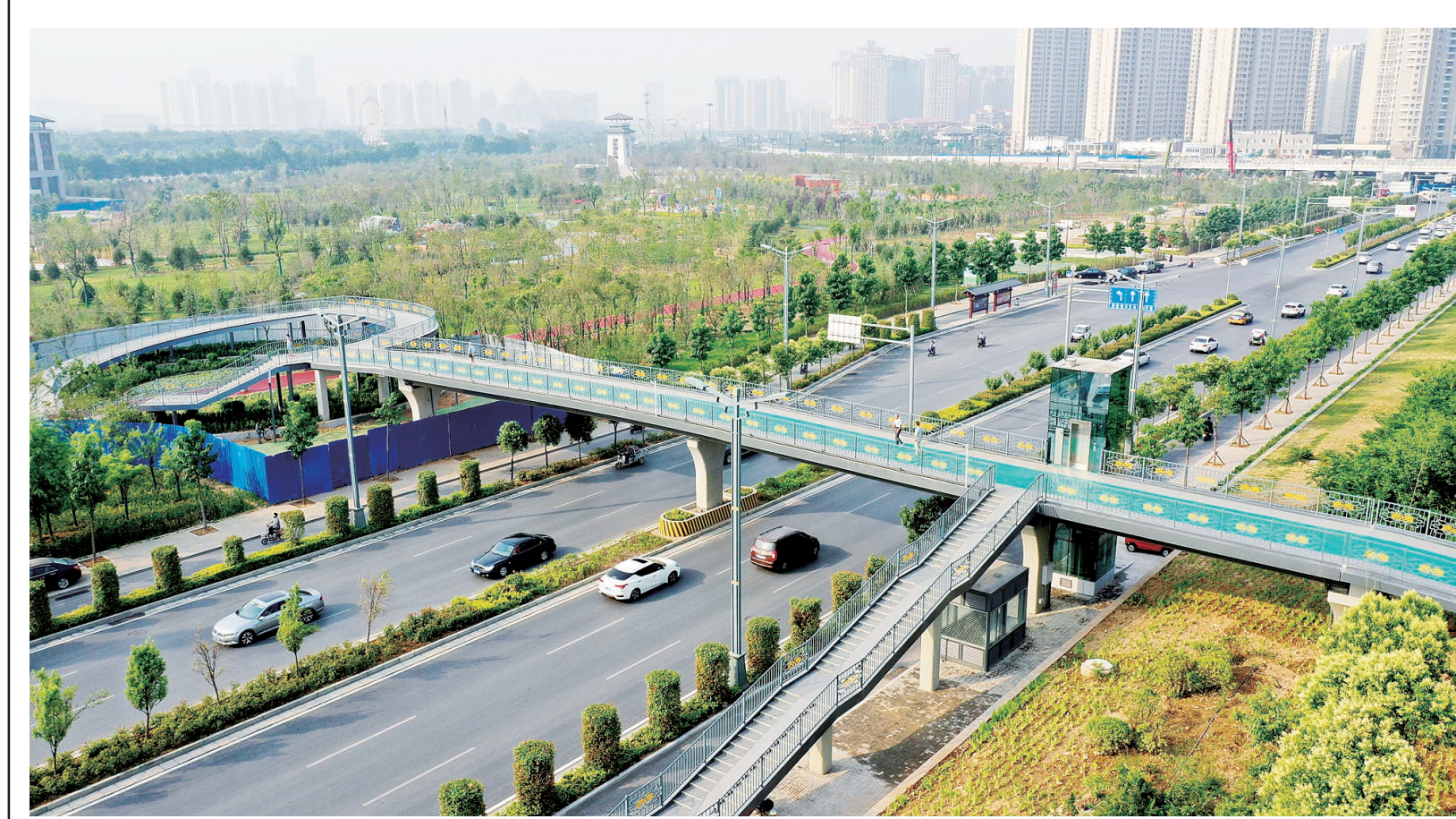
文博体育公园北门人行过街天桥投用

大道交叉口,去年8月1日开始主体结构建设,为地铁2号线与规划地铁4号线的换乘站,也是目前在建2号线一期工程的最后一站。该站建筑面积约2万平方米,为地下两层岛式车站,设计有4个出入口,5个物业开发出入口,3组风亭和2个消防疏散口。下一步,该站将展开出入口、风亭等站内外附属设施建设。