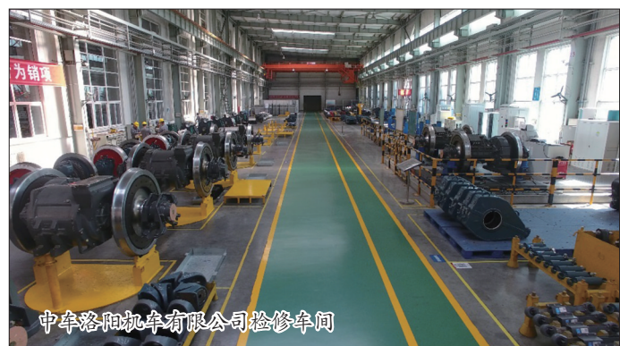
中车洛阳机车有限公司检修车间

创新产销模式,加强产销对接工作,收集辖区内上下游企业供需信息,完善企业产品信息库,积极推动“互联网+产销”,实现电子商务平台推广、精准销售。围绕现代产业体系,依托洛阳市工业产销对接平台,吸纳收集更多产品和企业信息。目前,全区已有40余家企业登录产销平台。今年该平台一季度发布购销信息10多条,促成8个,协议金额达1.45亿元。