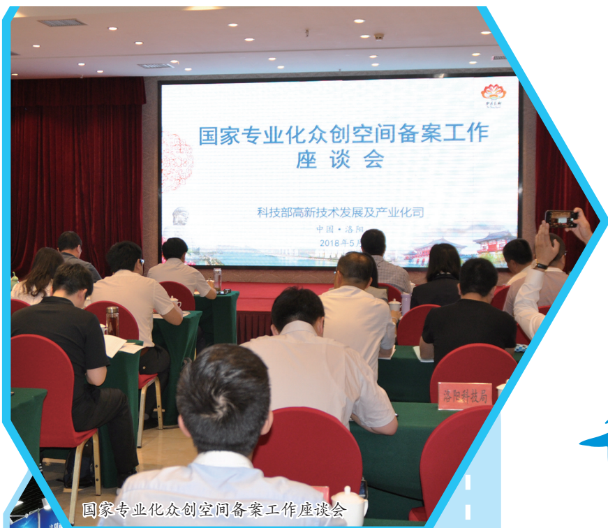
国家专业化众创空间备案工作座谈会