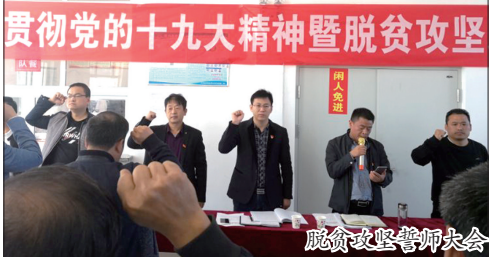
贯彻党的十九大精神暨脱贫攻坚