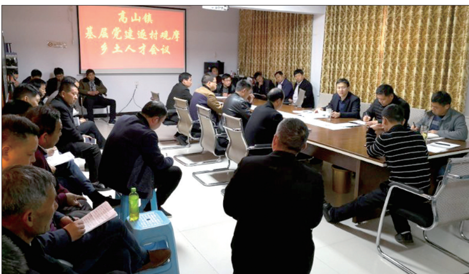
基层党建逐村观摩会现场

高山镇位于伊川西南部，距县城15公里，面积63平方公里，人口5.1万余。近年，高山镇以党建引领为根本，把各方力量凝聚在鲜艳的党旗下，以组织振兴带动乡村振兴，农村党组织的引领力得到了全面提升。同时，该镇把发展集体经济与脱贫攻坚、乡村振兴结合起来，通过强化党建引领、产业支撑、政策扶持、制度保障，推动集体经济由小到大、由弱变强，形成了干事创业不松劲、作风建设不松懈的良好局面。