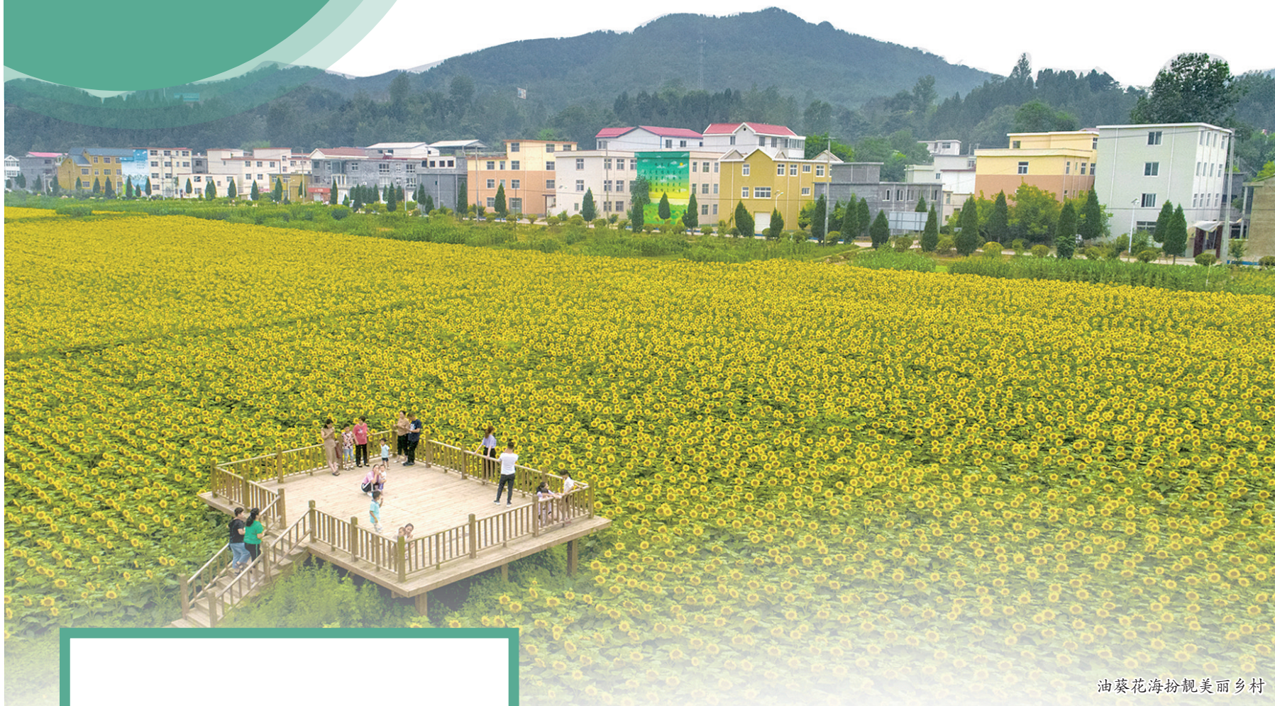
油菜花海扮靓美丽乡村