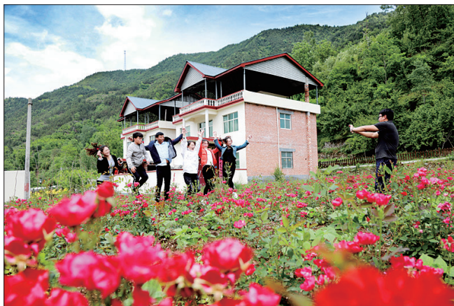
游客在乡村玫瑰园里合影