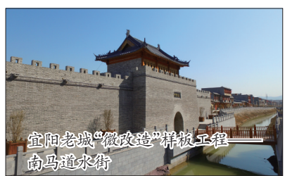
宜阳老城“微改造”样板工程 南马道水街

近日,宜阳县城关镇召开党政扩大会议,学习贯彻“宜阳县30项重点工程暨乡村振兴观摩活动”现场会精神。