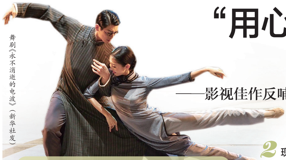
舞剧《永不消逝的电波》