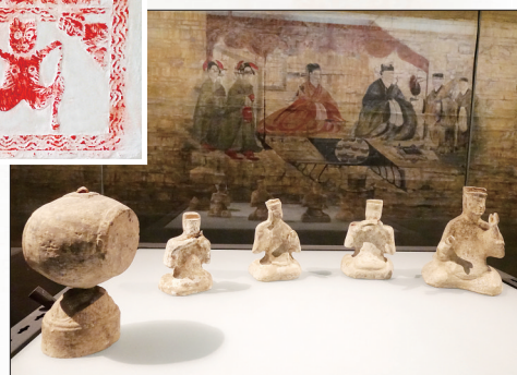
▶ 洛阳博物馆展品,汉代陶制建鼓和乐队