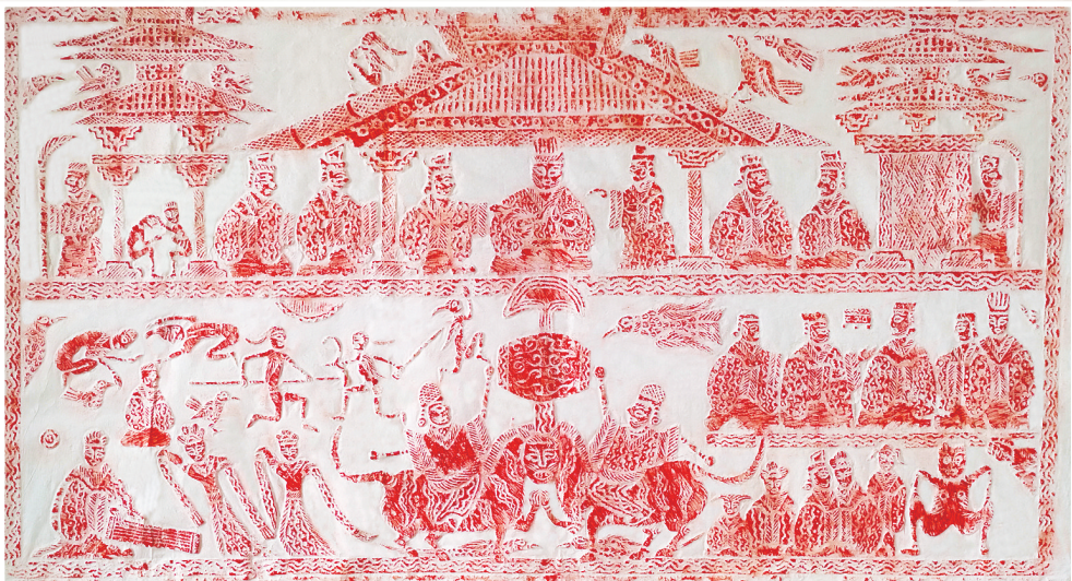
◀ 洛阳汉画艺术博物馆藏品《观赏鼓乐图》