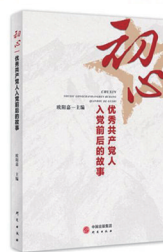
《初心》 作者:欧阳嘉 出版社:研究出版社

20世纪在世界东方,最激动人心与震撼人心的,莫过于中华民族从东亚病夫到东方巨龙、从百年沉沦到百年复兴这一历史命运的大落大起。各种政治力量在中国冲撞与较量,内外矛盾冲突空前尖锐,斗争局面极其复杂,各派力量的策略转换空前迅速。率领工农红军,通过万里长征这一中国共产党人的炼狱,通过严酷的围堵、不尽的跋涉、惊人的牺牲……使中华民族探测到了前所未有的历史深度和时代宽度,最终完成了中国历史上富有史诗意义的壮举。中国工农红军和中国革命也由此成为一只火中凤凰,从苦难走向辉煌。