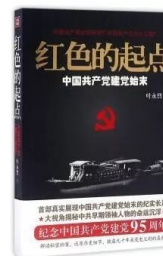
《红色的起点——中国共产党建党始末》 作者:叶永烈 出版社:四川人民出版社 华夏出版社

本书坚持认识与实践的统一,分为3个板块:第一板块主要是学习习近平重要讲话的体会,既有学习单篇著作的体会,又有学习系列讲话的体会。第二板块主要记录了在全党开展的集中性教育和经常性教育的情况。第三板块聚焦国有企业党的建设,针对对国有企业党的领导、党的建设弱化、淡化、虚化、边缘化的问题,既有理论阐述,正本清源,也有实践探索,推动党的建设重点任务落实落地。