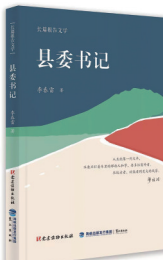
《县委书记》 作者:李春雷 出版社:党建读物出版社

本书揭秘秘密档案,披露世界最大政党诞生的台前幕后;还原历史细节,再现尘封的真相。中国共产党在上海诞生。本书作者以“地利优势”,在沪进行了长时间细致采访,又专程赴北京及嘉兴南湖访问,历经十余年考证,以客观的笔调,以创新的“T”字形结构,即既写横剖面为主——1921年中国共产党诞生的断代史,又写纵剖面——中共“一大”代表们的后来命运,娓娓道来中国共产党之由来。