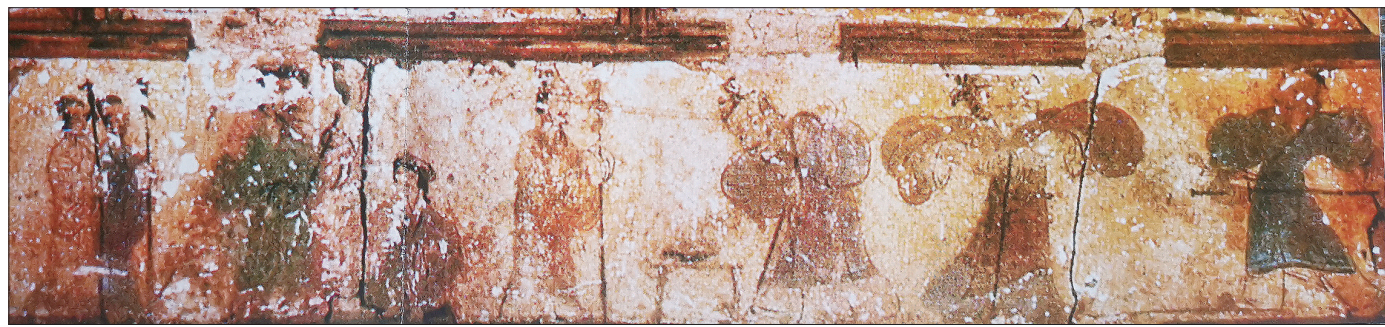
洛阳烧沟西汉墓壁画中的“二桃杀三士”图

“二桃杀三士”是中国古代一则历史故事,最早记载于《晏子春秋》。这个故事最打动人心的,是三士杀身成仁、舍生取义的“君子之风”。此故事在当时及后来的秦汉时期广为流传,把这类故事装饰在墓中,是为了标榜墓主人是具有这些优秀品质的人。