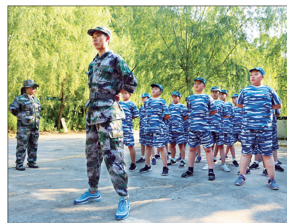
小营员接受严格的军事训练

夏令营趣味项目技术指导:北理华汇智能机器人基础实验室、洛阳HI-BOOM蹦床俱乐部