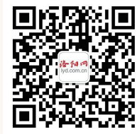
洛阳网微信二维码

投票结束后,将对公众投票情况和专家评审意见进行综合,报主办单位审核确认,最终评选出2019“洛阳最美教师”10名、2019“洛阳最美教师提名奖”10名,并将在今年教师节期间予以表彰。