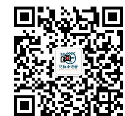
扫二维码了解夏令营最新动态