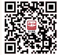
扫描二维码下载“掌上洛阳”手机客户端