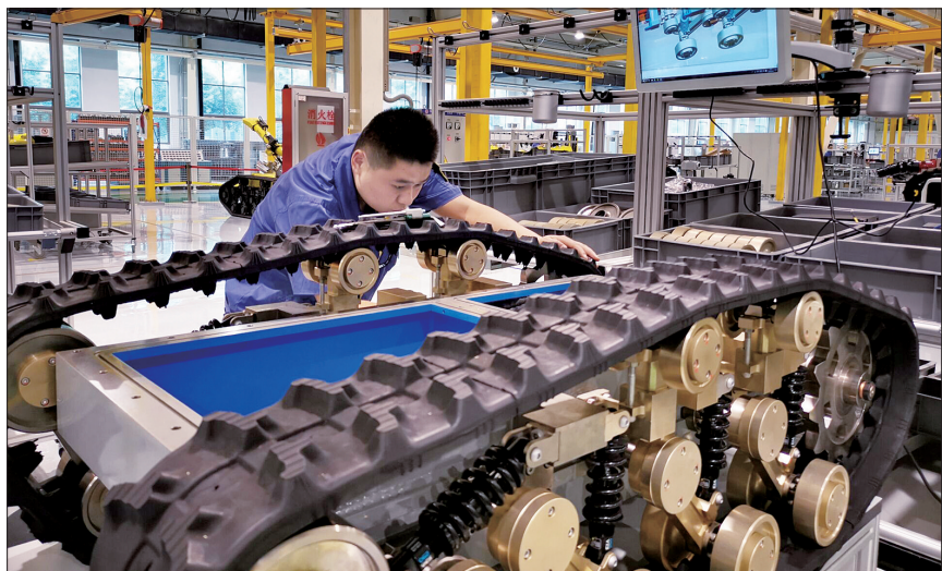
昨日，在中重自动化工程有限责任公司，一名技术人员正在检查生产线

当前培育省级智能车间(工厂)28家，占全省数量的10%；依托设立的10亿元产业发展基金，城市建成区内76家铸造、化工等高排放行业企业退城入园和智能转型正在加快推动。