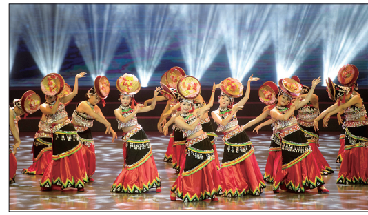
7月17日,演员在玉溪分会场开幕式上表演民族舞。当日,第六届中国聂耳音乐(合唱)周在云南开幕。本届音乐周以“礼赞新中国·奋进新时代”为主题,将在昆明、玉溪两地推出一系列丰富多彩的活动。

中国吴桥国际杂技艺术节创办于1987年,每两年举办一届。作为我国杂技艺术领域举办历史最长、规模最大、影响最广的国家级艺术赛事和文化节庆活动,吴桥杂技节与摩纳哥蒙特卡洛国际马戏节、法国巴黎“明日与未来”国际马戏节并称世界杂技三大赛场。(据新华社)