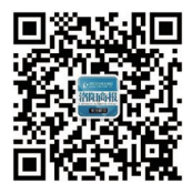
洛阳商报微信公众号