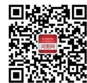
河图网微信公众号

在荷塘中央曲折折的木栈道上,前来赏花的游客有的独自细品,有的成群结队,有的拿着“长枪短炮”专心拍摄,有的摆出最美的姿势合影,还有的通过微信视频与远方的朋友及时分享荷塘美景……原本静美的荷塘,变得热闹起来,熙熙攘攘的游客也成了荷塘美景的一部分。(林治坤 文/图)