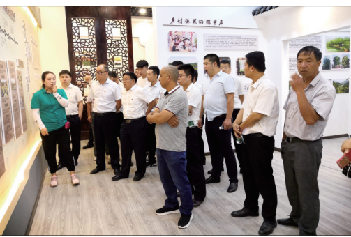
深入“百花工程”优秀信用村观摩学习