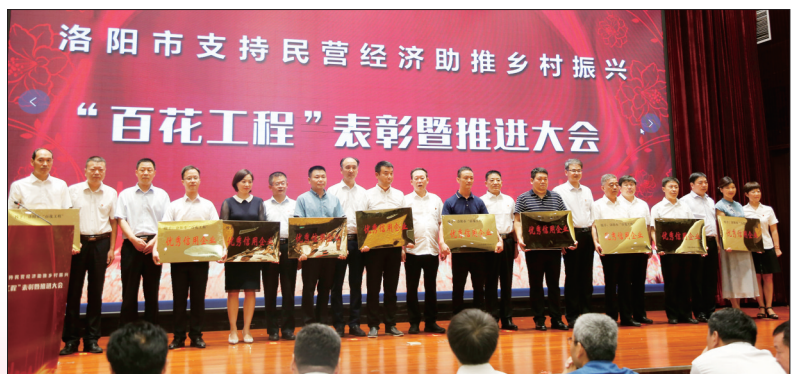
“百花工程”优秀信用企业领奖