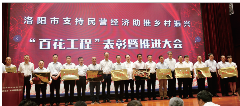
“百花工程”优秀信用村领奖