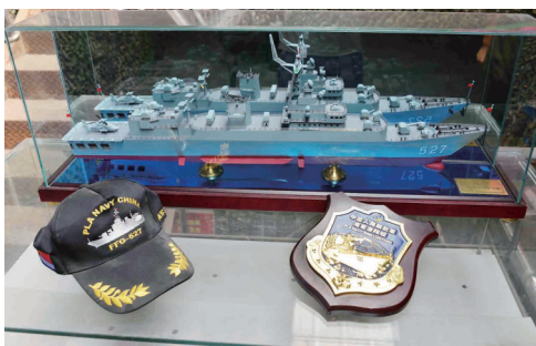
洛阳舰官兵赠送我市双拥慰问团的纪念品