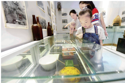
小朋友仔细打量展品实物