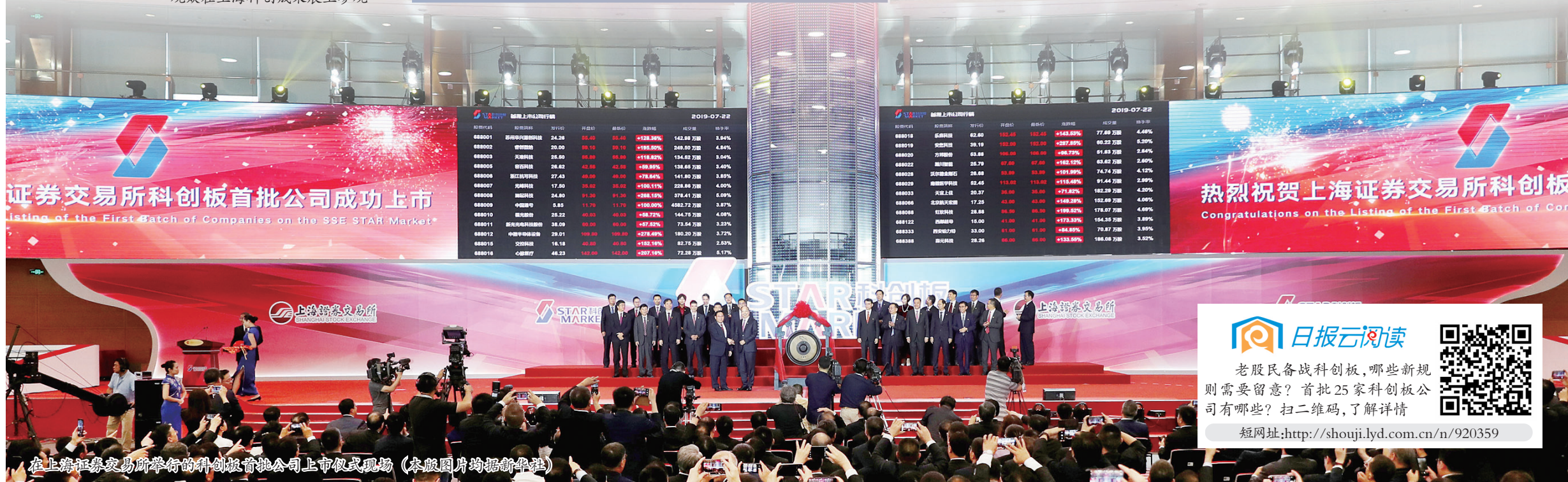
在上海证券交易所举行的科创板首批公司上市仪式现场