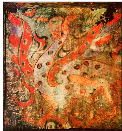
西汉卜千秋壁画墓中的王子乔形象

人面鸟身、面容清秀、尖尖的耳朵、羽翼华丽……这就是西汉卜千秋壁画墓中王子乔的形象。那么王子乔是谁?为什么汉人要把他画在墓中呢?