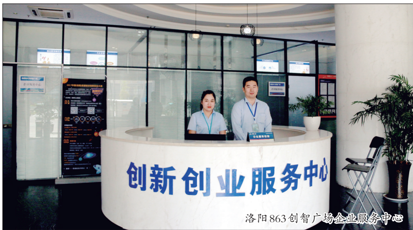
洛阳863创智广场企业服务中心

2016年至2018年，在全市小微两创工作考核中，洛龙区连续3年在城市区中排名第一，荣获城市区优秀奖。