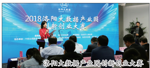
洛阳大数据产业园创新创业大赛