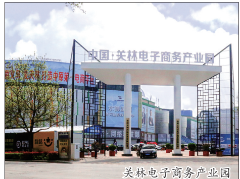
关林电子商务产业园

优服务。 洛龙区集合全区12家产业科技园成立区大数据产业园管理中心，专业服务信息类小微企业；成立特色商业街区办公室，出台《关于洛龙特色商业区建设暂行奖励优惠政策意见》，专业扶持商贸服务类小微企业发展；成立创业服务中心，服务创新创业类小微企业，服务河南科技大学科技园、洛阳理工大学科技园加速器、中航联创等大学生两创载体项目，共同推动全区小微企业的创业创新发展。