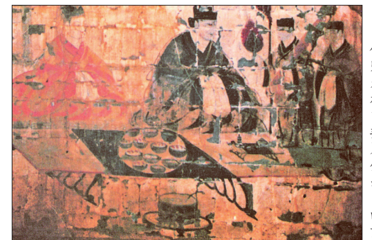
偃师朱村曹魏墓壁画中的案