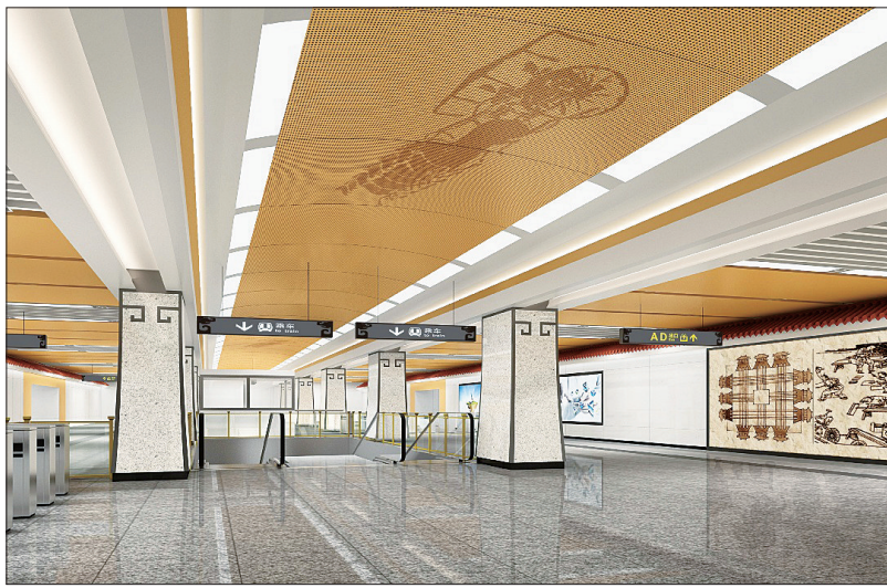
周王城广场站 本站主题:两周故事

市轨道交通集团相关负责人介绍,按照市委、市政府“开门办规划”和“建地铁就是建城市,建地铁必须有文化”等要求,为进一步完善概念设计成果,便于下一阶段详细方案设计工作开展,现将有关概念设计成果进行公示,广泛征求社会各界的意见和建议。