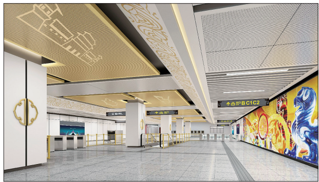
应天门站 本站主题:盛唐雄风