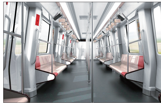
地铁车辆内饰方案之一