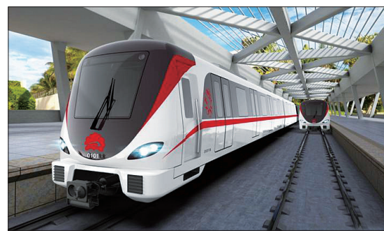
地铁车辆外观方案之一