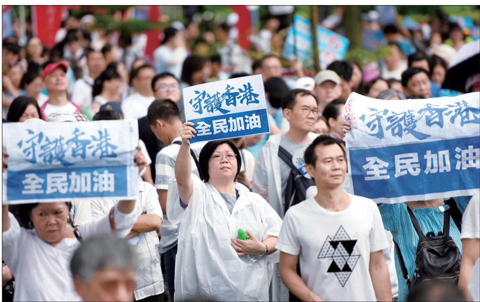
7月20日下午,香港各界举行“守护香港”大型集会,呼吁维护法治、反对暴力

发言人说,希望香港社会各界人士坚决守护法治。法治是香港人引以为傲的核心价值,是香港良好的营商环境的基础,是香港保持繁荣稳定的重要基石,绝不能坐视一小部分人肆无忌惮地践踏。法治的支柱一旦动