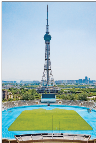
天然草皮铺设完毕