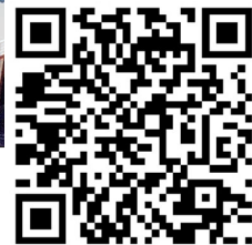
扫二维码,观看相关视频