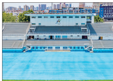
外观大气的主席台