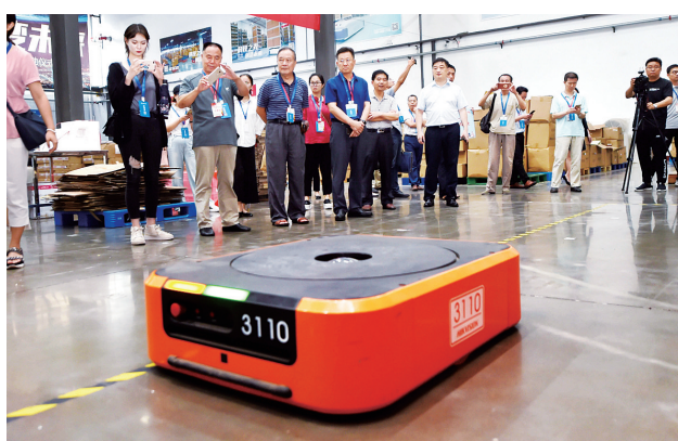
百姓参观团参观中浩德电子商务产业园