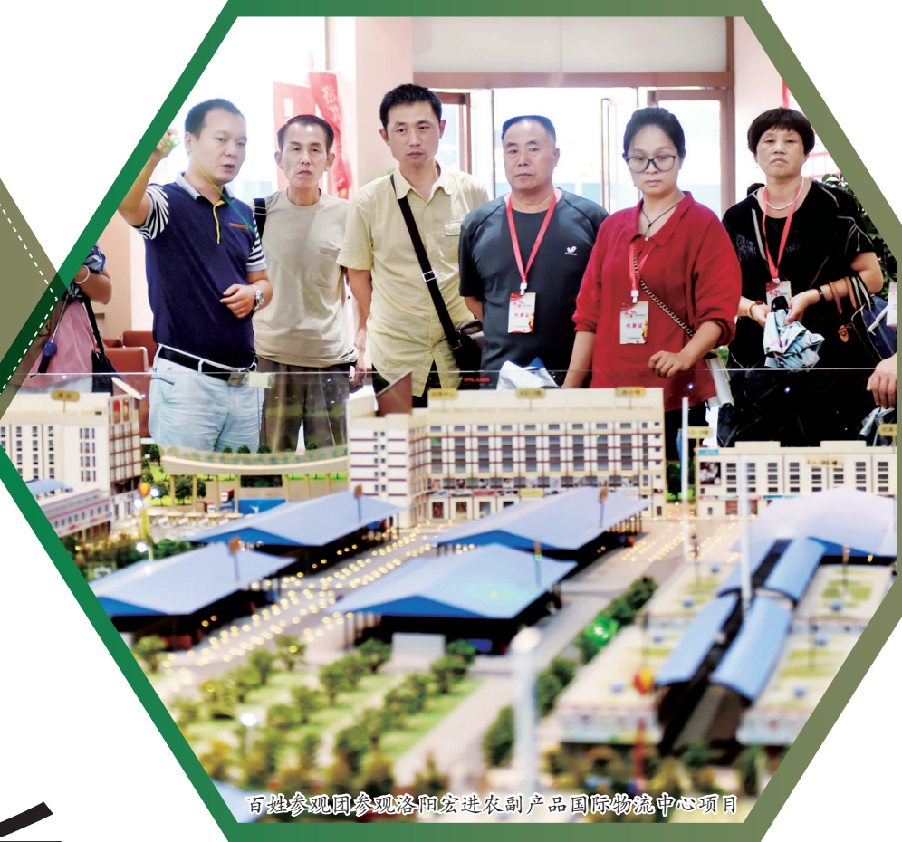
百姓参观团参观洛阳宏进农副产品国际物流中心项目

在社会主义市场经济条件下,市场在资源配置中起决定性作用。新中国成立70年来,是洛阳消费市场翻天覆地的70年。市统计局发布数据显示,反映消费品市场发展水平与规模的统计指标——社会消费品零售总额,由1978年的6.03亿元增加到2018年的2154.9亿元,增长了356.4倍。数字背后,是洛阳日臻完善的商品市场。特别是近几年,我市加快构建现代市场体系,市场主体活力显著增强,市场开放水平明显提高,市场环境更加优化,商品消费市场呈现出前所未有的繁荣活跃景象。6日,由市委宣传部和市发改委共同组织的“百姓看市场”活动举行,来自我市各个领域的20多名群众代表集中参观6家不同类型市场代表单位,看变化、话发展,感受洛阳市场体系的升级步伐。