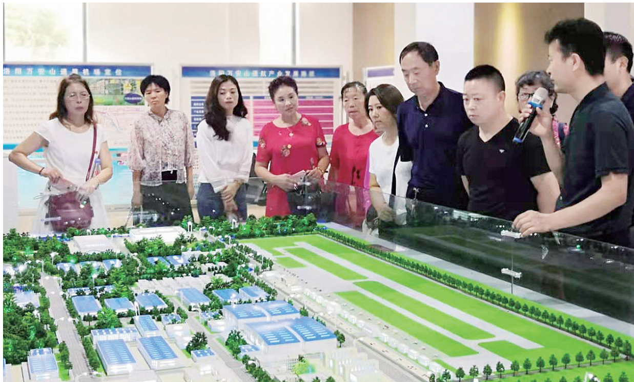
市民群众代表在龙门通用航空机场项目基地了解通航产业园规划情况

8月13日，由市委宣传部、市自然资源和规划局共同组织的“百姓看城镇化”活动举行，来自我市各个领域的20多名群众代表集中观摩我市城镇化建设的新成效，认真感受洛阳城镇化高质量发展带给市民群众的获得感、幸福感。“更有颜值更具气质，洛阳城镇化建设今非昔比！”观摩期间，市民群众代表纷纷称赞我市城镇化建设“工笔画”越画越漂亮，以人为本的城市特质愈加彰显，古今辉映、山环水绕的城市特色愈加清晰。