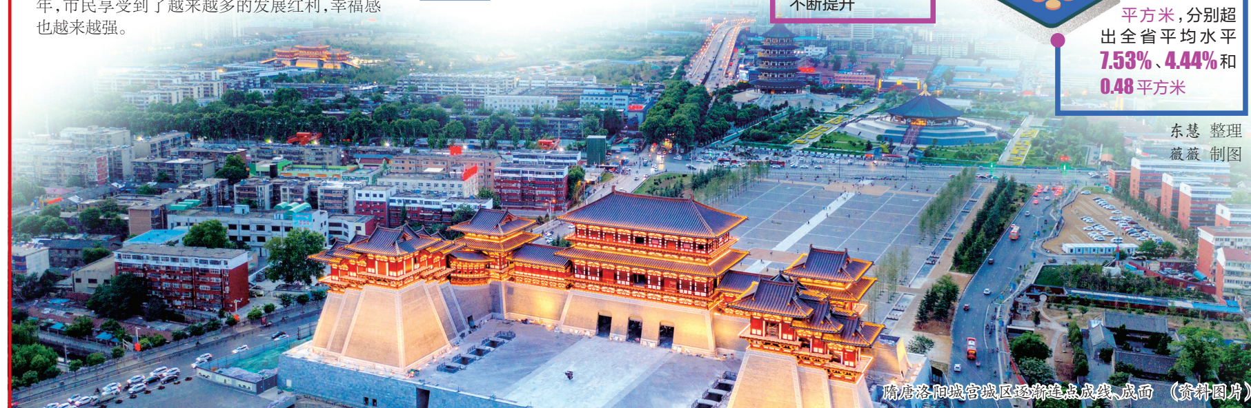
隋唐洛阳城宫城遗址逐渐连点成线、成面 (资料图片)