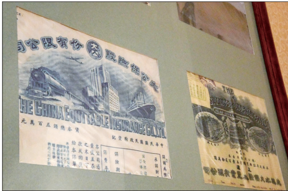
民国保单上的眉标图