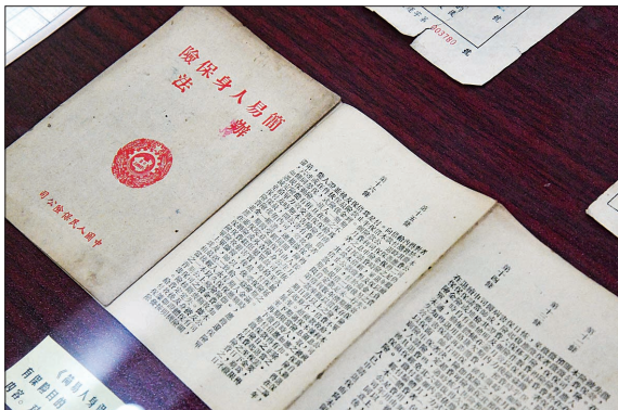
中国人民保险公司1951年2月制定的《简易人身保险办法》