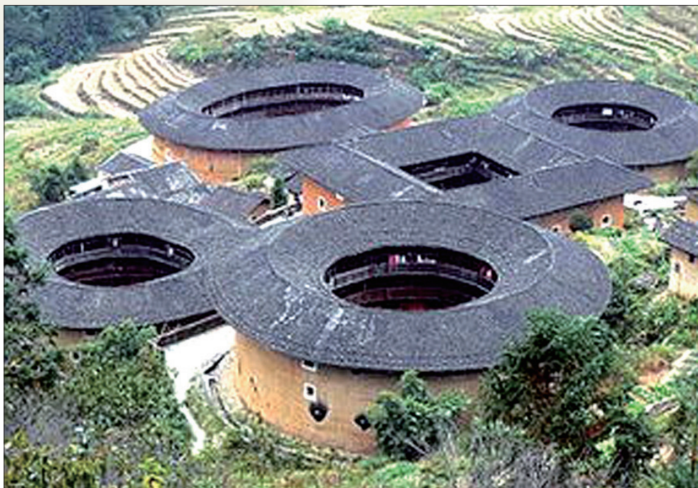
客家围屋(资料图片)

客家人“根在河洛”,客家人从河洛地区带到全国以至世界各地的不只有客家的民俗、语言,还有自己独特的建筑。客家围屋是客家文化中著名的特色民居建筑,是中国五大民居特色建筑之一。追本溯源,客家围屋这种建筑,是东汉魏晋时期河洛坞堡的移植。