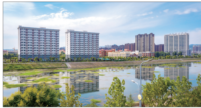
为河道“美容”护碧水清流

在此前全省通过评估验收的四批国家级绿色矿山中,我市已有洛阳铝业集团三道庄铝矿等7家矿山入选,同时栾川县正着力创建绿色矿山发展示范区。至此,我市国家级绿色矿山总量达到19家,占全省总数95家的20%,居全省首位。