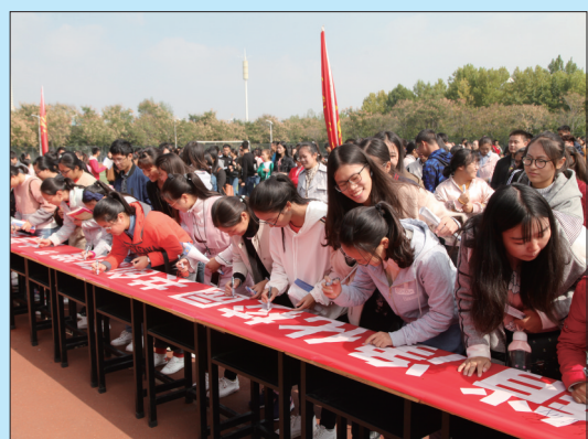
防范传销进校园大学生万人签名活动

在国家市场监督管理总局、省市场监督管理局和市委、市政府的坚强领导下,市市场监督管理局始终坚持把打击传销作为维护社会稳定、优化发展环境的一项基础工程,与相关部门紧密配合,紧紧围绕“决不让传销在洛阳立足,竭力维护社会和谐稳定”这一目标,坚持做到更加注重主动出击、更加注重行刑衔接、更加注重查办大要案件、更加注重摧毁传销网络,全力推动洛阳打击传销规范直销工作取得新成效,确保不发生影响社会稳定的传销事件,为维护规范有序的消费环境作出了积极贡献。