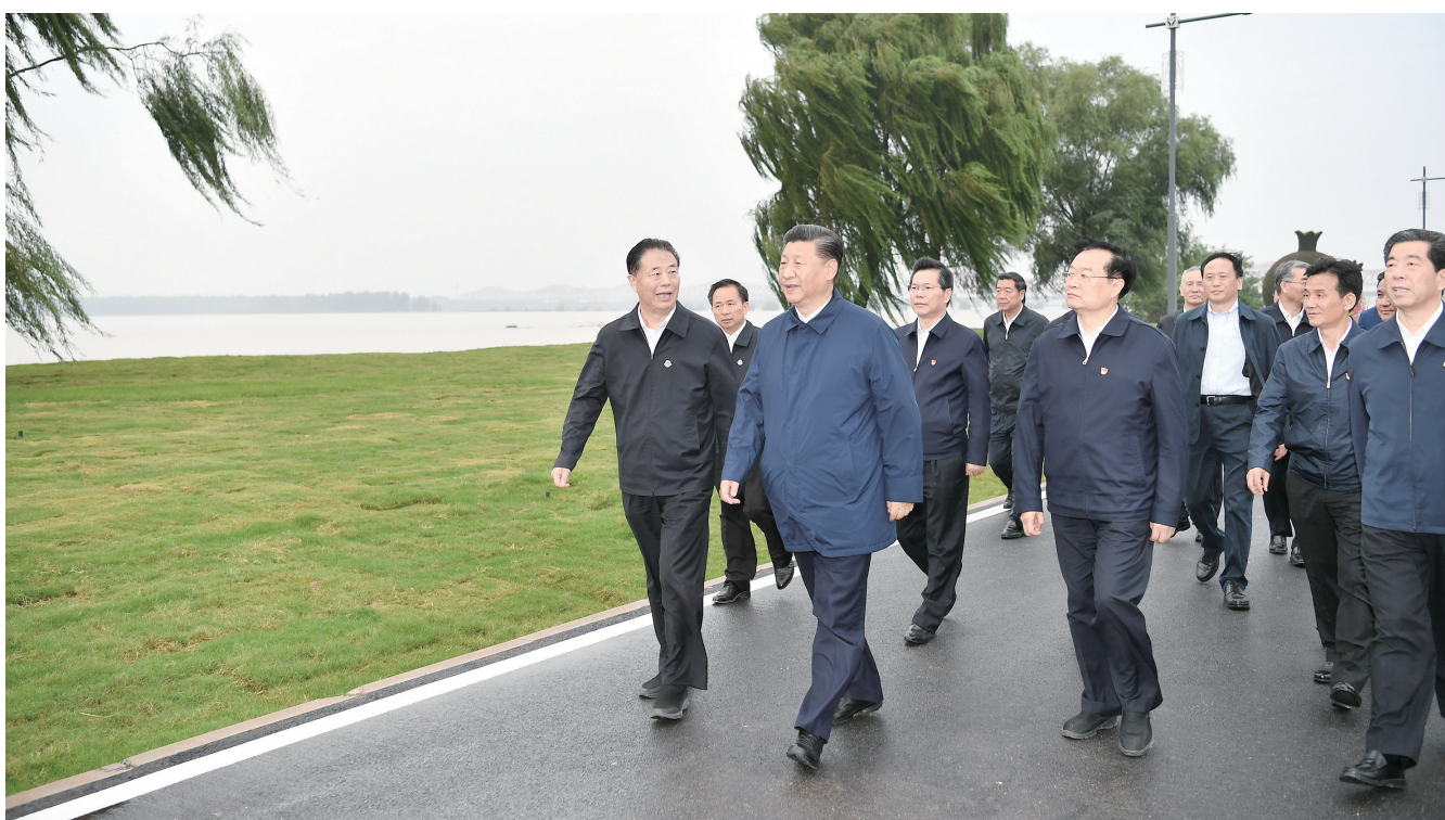
9月18日上午,中共中央总书记、国家主席、中央军委主席习近平在郑州主持召开黄河流域生态保护和高质量发展座谈会并发表重要讲话。这是座谈会前,习近平于17日下午在郑州黄河国家地质公园,沿黄河岸边步行察看周边环境,了解沿黄地区生态保护、水资源利用、堤防建设和防洪形势等情况。

(上接01版)黄淮运三河并治,褐色的堤防体系蜿蜒起伏;站在清代郑工合龙处碑拓片前,他仔细端详。碑文记载了清代最大一次堵口事件,“兵夫力作劳苦久”,治河之艰辛历历在目。