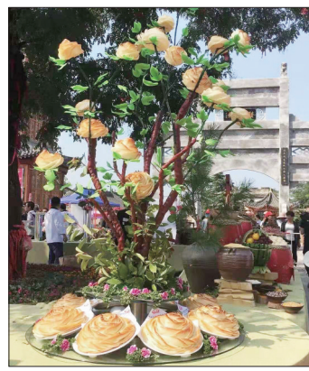
丰收盛宴

市委第四、第五、第六、第十五、第十八、第十九巡回指导组等分别到会指导。 本报记者 李梦龙 通讯员 王国辉