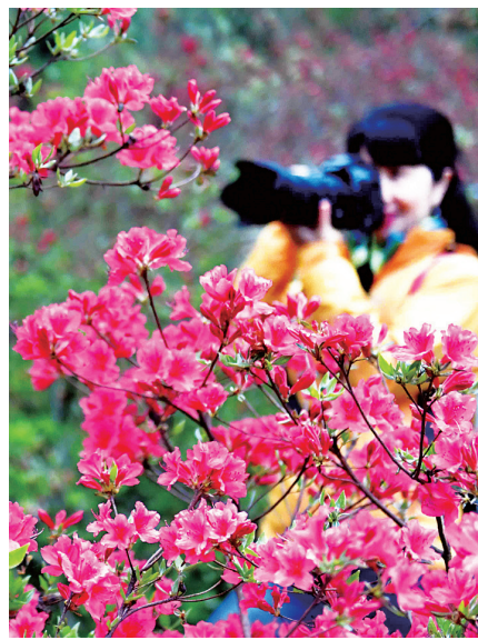
西泰山红杜鹃

娱乐等于一体。在汝阳县城东南4公里的云梦山下，有一个云梦村。云梦村曾叫鬼谷村，相传是“兵韬鼻祖”鬼谷子出生及修道、授徒的地方。孙臆、庞涓、苏秦、张仪等都出自鬼谷子的门下，因此，云梦村又被称为“天下第一军校”。目前，这里正发展以鬼谷文化为中心的特色景区。