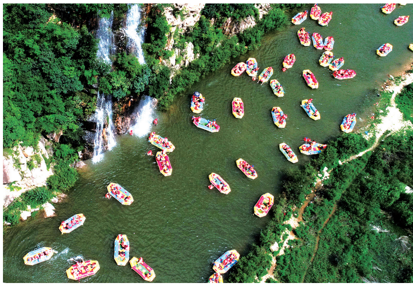
汝阳恐龙谷漂流

“醉美汝阳”，美不胜收。这里是“中国林(shù)酒”——杜康酒的发源地，亚洲最大的恐龙化石——巨型汝阳龙的发现地，有“中国杜康文化之乡”“中国恐龙化石之乡”的美誉；这里有炎黄文化、仰韶文化、以及云梦鬼谷子故里、恐龙遗址园等遗址遗迹；这里有旅游资源丰富，全县旅游单体数量达1222个，融奇山、秀水、密林、繁花、峡谷、漂流、地质、温泉等于一体，发展文化旅游得天独厚。