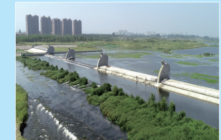
国内最长的橡胶坝——伊河东段橡胶坝建成投用