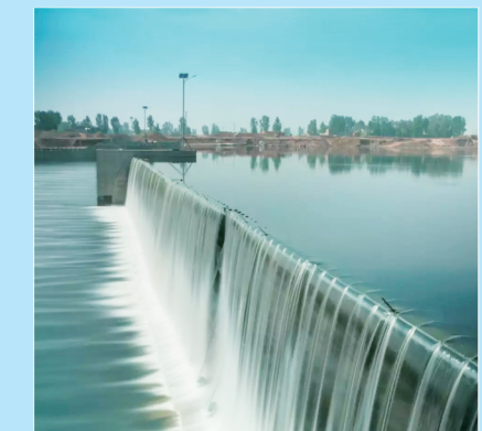
国内最高的气盾拦河坝——洛河东气盾坝拦蓄水

此次喜获特别奖的洛阳伊洛河水生态示范区项目,确保了水生态示范区防洪标准提高到100年一遇,除涝标准提高至5年一遇。该项目对加快城市化建设,促进区域经济发展;完善伊洛河水生态示范区服务功能,加快旅游业的发展;解决地区水资源时空分配不均,补充地下水资源具有重要意义,是开展生态环境与经济效益有机结合的重要尝试。