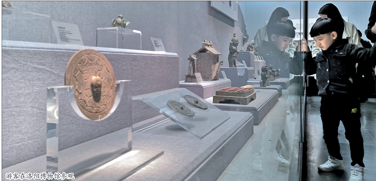
游客在洛阳博物馆参观

“延长博物馆开放时间,不仅能丰富市民和游客的夜间活动项目,也给洛阳旅游“夜经济”注入新活力。”洛阳博物馆相关负责人说,博物馆夜间开放的