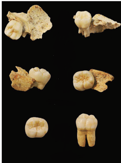
孙家洞遗址发现的古人类牙齿化石

古人类化石是研究人类起源演化的直接证据,中更新世是探索直立人演化及现代人起源的关键时期。在栾川县栾川乡湾滩村伊河南岸呼呼崖上的孙家洞遗址,考古人员发现的直立人儿童化石极其珍贵,为研究东亚古人类起源与演化提供了新的证据。