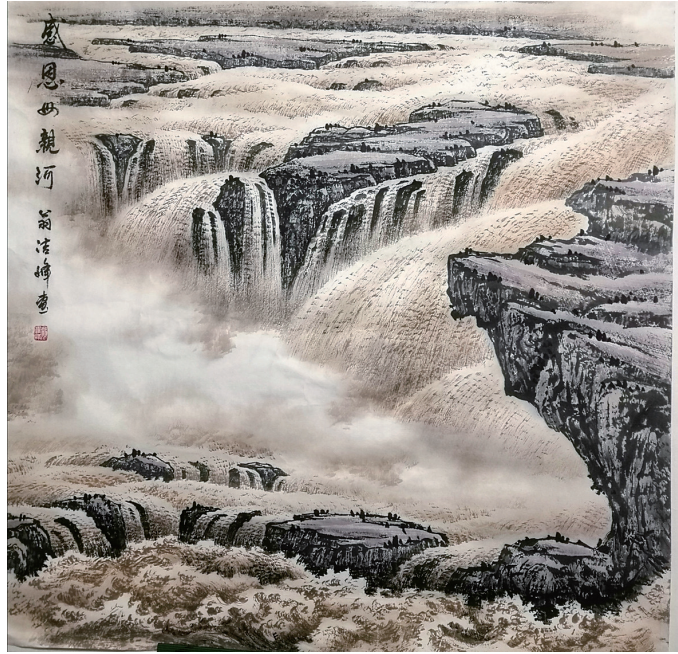
感恩母亲河 翁浩峰画

习近平总书记在《在黄河流域生态保护和高质量发展座谈会上的讲话》中说:“黄河文化是中华文明的重要组成部分,是中华民族的根和魂。”近日,河南大学黄河文明与可持续发展研究中心召开了学习习近平总书记重要讲话座谈会。在会上,我以《中华民族的根和魂》为题,谈了我学习习总书记讲话的心得体会。