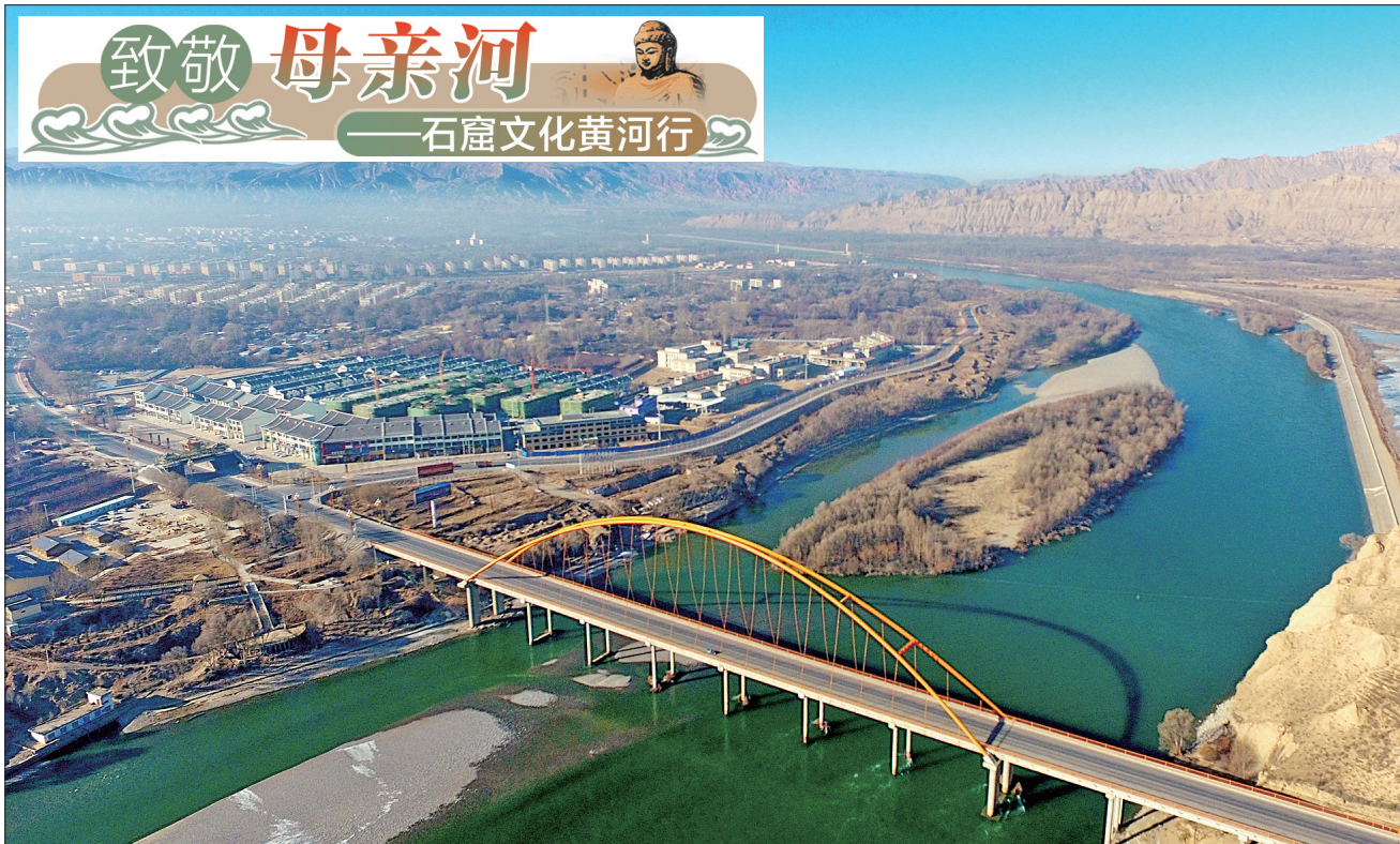
黄河贵德县县城段