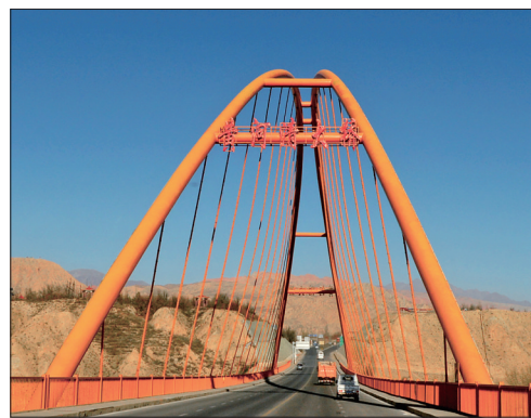
▲ 贵德黄河清大桥 ◀ 黄河岸边“天下黄河贵德清”纪念碑