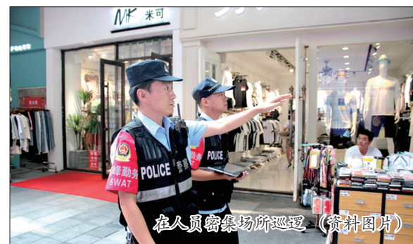
在人流量密集场所巡逻 (资料图片)