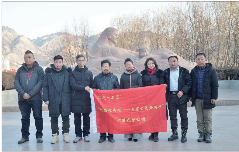
采访团在兰州黄河母亲像前合影