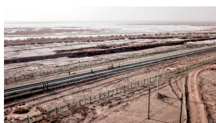
1月20日,在距离新疆伽师县地震震中约10公里处,铁路工人在沿线检修线路