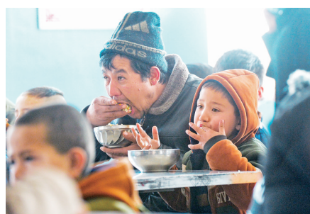
1月20日,在新疆伽师县卧里托格拉克镇第三小学的安置点,受灾群众在吃午饭