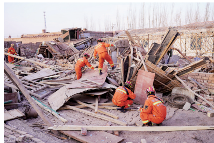
1月20日,新疆喀什地区消防救援支队队员在伽师县西克尔库勒镇西克尔村清理民房杂物,排查安全隐患