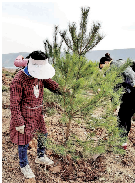
新安县掀起沿黄绿化高潮

城市“绿芯”的要求,我市加快推进沿黄生态廊道建设、黄河湿地保护和修复,计划通过五年努力,在黄河两岸营造水源涵养林、水土保持林、固堤林、经济林13万亩,其中2020年规划沿黄生态廊道建设3.2万亩(含飞播1万亩),目前已完成1.8万亩。同时,我市强力实施黄河湿地保护工程,塑造黄河两岸河滩湿地水鸟竞翔、堤岸道路绿色长廊、