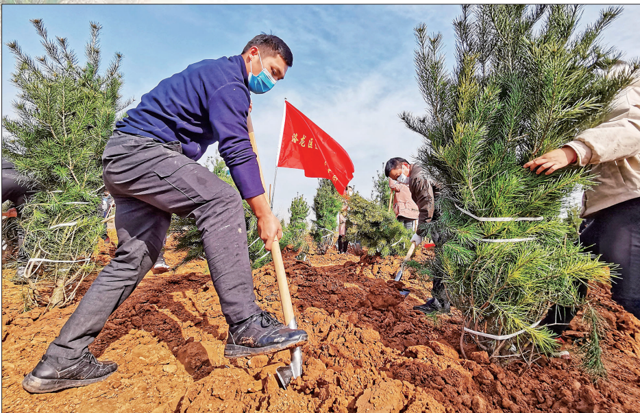
洛龙区开展春季义务植树活动