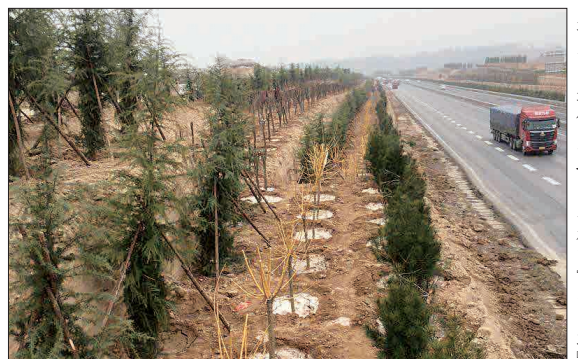
连霍高速偃师段沿线植下“生态绿”