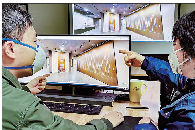
人们通过VR全景技术浏览二里头夏都遗址博物馆