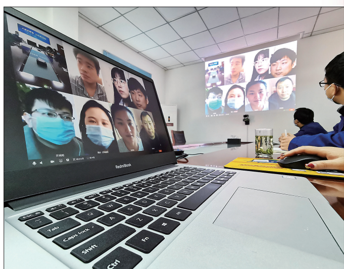
在老城区古都科创园,洛阳信成精密机械有限公司专门搭建视频会议室进行“云办公”