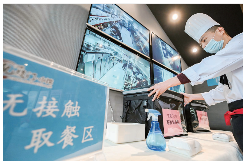
洛龙区政和路厚载门街口的一家连锁餐饮门店推出美食外卖、无接触取餐“云”服务

在抗击新冠肺炎疫情的特殊时期,我市不少行业创新举措,纷纷借助网络开启“云端”模式,销售直播、在线教育、“云办公”、VR(虚拟现实)全景游览、线上相亲等,让“云生活”逐渐成为一种新的生产、生活方式。