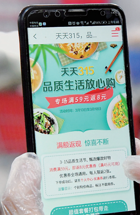
电商平台订单量激增,洛报集团旗下综合电商平台适时推出多种优惠活动