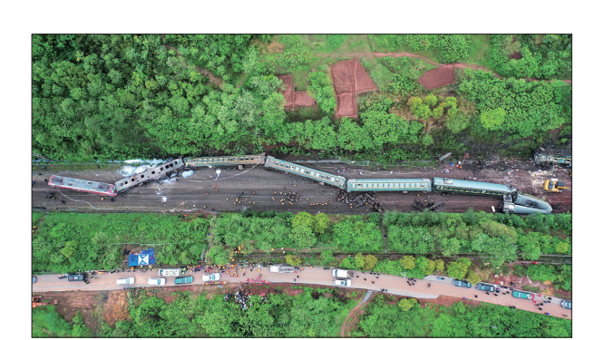
京广铁路火车脱轨 3月30日拍摄的火车脱轨现场。当日11点40分许，T179次列车途经京广铁路湖南省郴州市永兴县高亭司镇永华村路段时，因附近山体滑坡，撞上塌方体，中断行车。据郴州市相关部门消息，截至目前，事故已造成1人死亡，4人重伤，123人轻伤。伤员正送往附近医院紧急救治。

会议指出，当前巩固疫情防控成果，防止出现防控漏洞，必须突出做好无症状感染者监测、追踪、隔离和治疗。要有针对性加大无症状感染者筛查力度，将检测范围进一步扩大至新冠肺炎病例和已发现的无症状感染者的密切接触者、有特殊要求的重点地区和重点人群等。一旦发现无症状感染者，要立即按“四早”要求，严格集中隔离和医学管理，公开透明发布信息，坚决防止迟报漏报，尽快查清来源，对密切接触者也要实施隔离医学观察。抓紧在疫情重点地区抽取一定比例样本，开展无症状感染者调查和流行病学分析，研究完善防控措施。同时，做好患者出院后按要求复查，加强复阳人员医学管理等工作。